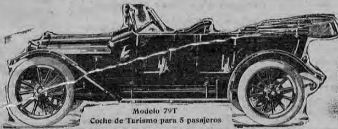
Modelo 79T Coche de Turismo para 5 pasajeros

Fabricantes de los famosos Camiones Overland, Camiones "Garford" y "Willys-Utility". Informes a solicitud.